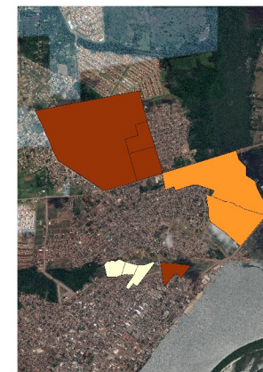
Localização dos assentamentos precários