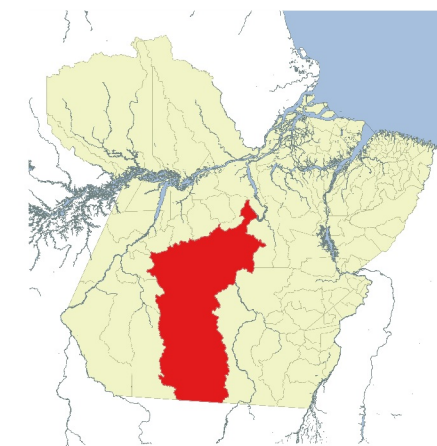
Mapa de localização do município no Estado do Pará

Datum: SIRGAS 2000 UTM ZONE 22S Elaboração: Brenda Santos Rodrigues